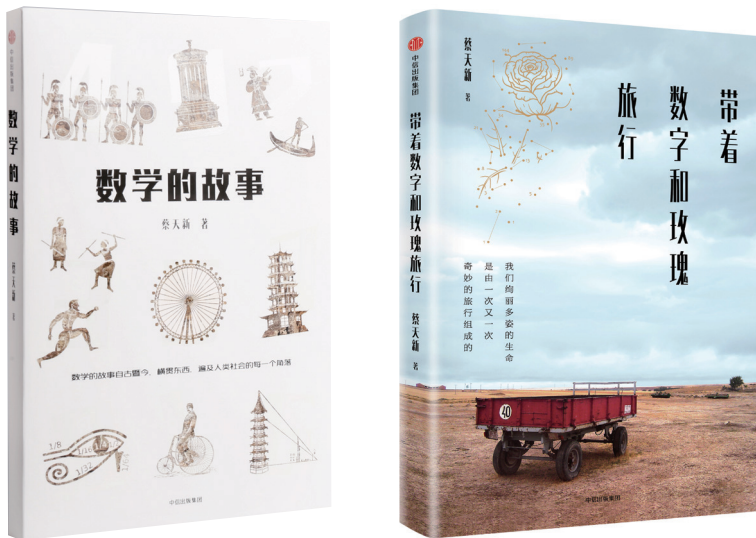
《数学的故事》和《带着数字和玫瑰旅行》

上述数学文化类著作的出版，受到了读者的欢迎，也给我带来一些荣誉，包括相继获得科研和教学方面的国家级奖项。与此同时，我也意识到并形成一