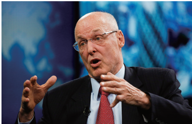
美国第 74 任财政部长亨利·保尔森